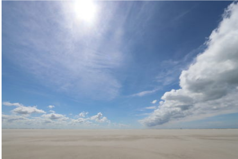
vakantiestrand, wijsheid, straffe wind, licht, kleur, betoverend

Zit "uw wijn" er niet bij? kijk dan op: degoedewijnen.html