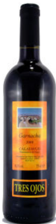
Tres Ojos Garnacha 2008

Daarom nu eens extra in het zonnetje, vóórdat er weer van alles aan "nieuws" binnenkomt, nu het (herfst)weer om een beetje extra warmte vraagt en omdat deze wijn, gemaakt van oude stokken (zie foto) gewoon te goedkoop (€ 4,65) is voor zijn kwaliteit: